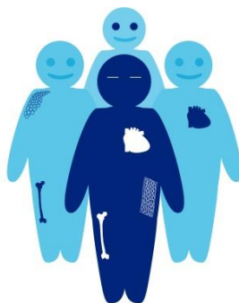
Equip de Coordinació de Donació de Teixits FPHAG